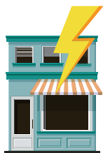
B) Danos elétricos;