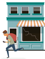
C) Roubo de bens;