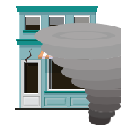
D) Vendaval, Furacão, Ciclone, Tornado e Granizo.

Essa cobertura tem o objetivo de indenizar os danos com fusão, carbonização, queima ou derretimento de fios e circuitos elétricos ou eletrônicos, causados por condições acidentais elétricas;