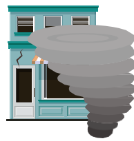
D) Vendaval, Furacão, Ciclone, Tornado e Granizo;