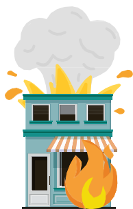
A) Incêndio, Queda de Raio e Explosão;