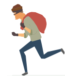
C) Roubo e Furto Qualificado de Bens:

Garante o pagamento de danos materiais causados à empresa ou interesses do segurado, em consequência de danos decorrentes de evento coberto pela apólice;