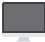
E) Equipamentos ou Objetos Portáteis.