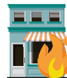
A) Incêndio, Queda de Raio e Explosão:

Garante o pagamento de danos materiais causados à empresa ou interesses do segurado, em consequência de danos decorrentes de evento coberto pela apólice;